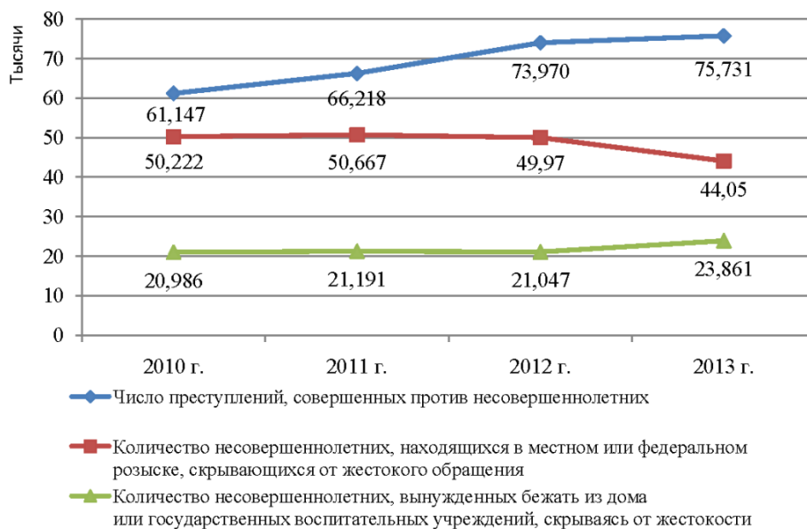
Рис. 1. Динамика показателей, характеризующих степень жестокого обращения с несовершеннолетними в России

В результате анализа мы наблюдаем рост числа преступлений, совершенных против семьи и несовершеннолетних (рис. 1) [1].