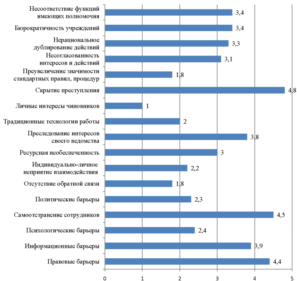
Рис. 3. Частота барьеров взаимодействия при организации и проведении совместной работы по решению проблем безнадзорности, беспризорности и жестокого обращения с несовершеннолетними (по ответам экспертов) ( n = 296 )

Самоотстранение сотрудников, возникающее при отсутствии внутреннего удовлетворения трудом, является одним из опасных барьеров, способных привести к неэффективности деятельности соответствующих учреждений.